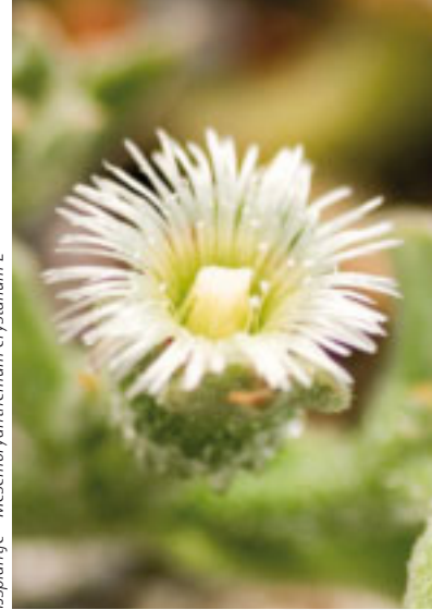
Ijsplantje - Mesembryanthemum crystallinum L.

Breng eerst Huidconditioner S licht deppend aan als je huid lichtjes verbrand is, voordat je After Sun Lotion aanbrengt. Huidconditioner S haalt direct de 'brand' uit je huid. Het is verstandig om tijdens je zonzvakantie een doosje Huidconditioner S met 10 ampullen bij je te hebben.