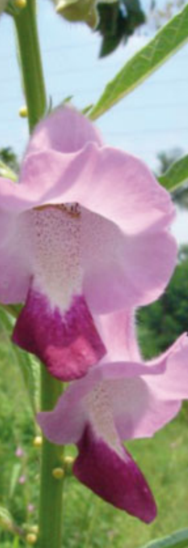
Indische sesam - Sesamum Indicum